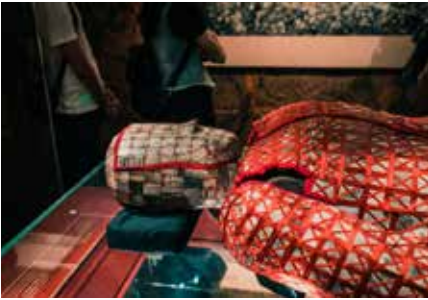
Batı Han Hanedanı Mozaikleri Müzesi (西汉南越王墓博物馆)

Adres: Yuexiu District, Guangzhou, Çin, 510115