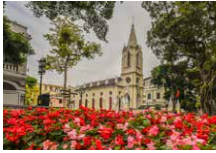
Şamian Adası (沙面岛)

Adres: 259 Dongfeng Middle Rd, Yuexiu District, Guangzhou, Guangdong Province, Çin, 510013