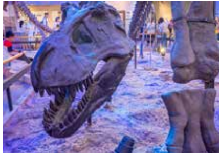
Guangdong Müzesi (广东博物馆)

Adres: 867 Jiefang N Rd, Yuexiu District, Guangzhou, Guangdong Province, Çin, 510040