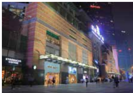
Grandview Mall (正佳广场)

Adres: No.383 Tianhe Road, Tianhe District, Guangzhou 510620 China