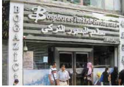
Bosphorus铂斯西餐厅·土耳其烧烤(环市中路店)