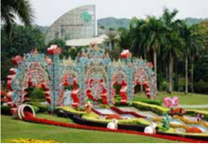
Baiyun Dağı (白云山)

Adres: Çin, Guangdong Province, Guangzhou, Liwan District, 中山七八路恩龙里34号 邮政编码: 510040