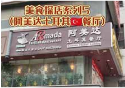
Armada阿美达中东料理 (环市东路店)

Adres : 越秀区环市东路376号 易尚国泰酒店2A层 (淘金地铁站A出口)