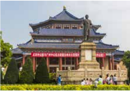
Sun Yatsen Anıt Salonu (中山纪念堂)

Adres: 56 Guangta Rd, 中山六路 Yuexiu District, Guangzhou, Guangdong Province, Çin, 510030