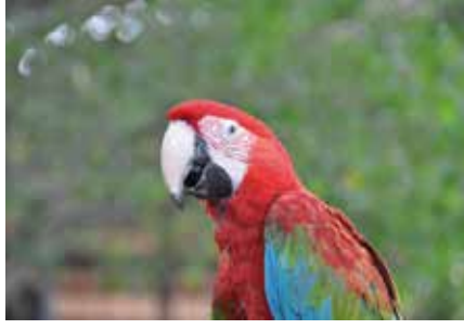
Chimelong Safari Parkı (长隆野生动物园)

Adres: Yuejiang W Rd, Haizhu District, Guangzhou, Guangdong Province, Çin, 510308