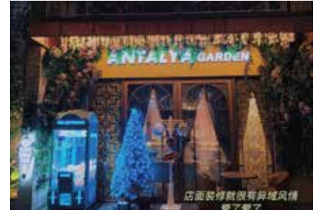
Antalya 安塔利亚土耳其餐厅 (猎德店)

Adres : 天河区猎德大道二号西浦大街第12栋29A-30A (天盈广场东塔马路对面)