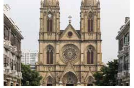
Kutsal Kalp Katedrali (石室圣心大教堂)

Adres: X8WH+MG9, Han Xi Da Dao, Panyu District, Guangzhou, Guangdong Province, Çin, 511495