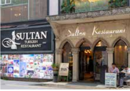
苏坦土耳其餐厅(白云宾馆店)