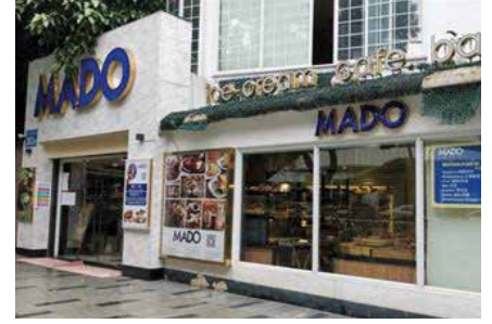
MADO冰淇淋咖啡馆(淘金店)

Adres: 9 Nolu Dükkan, Kat 1, Zhaoqing Plaza, No. 304 Huanshi Orta Yolu, Hongqiao Caddesi (Xiaobei Metro İstasyonu yakınında)