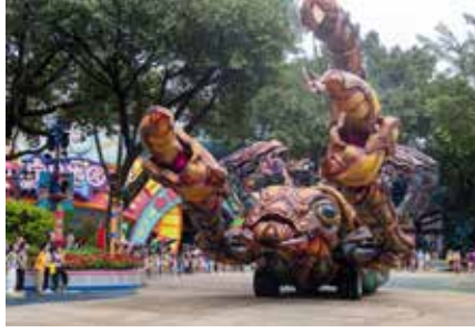
Chimelong Eğlence Parkı (长隆欢乐世界)

Adres: Baiyunshan, Baiyun, Guangzhou, Guangdong, Çin, 510599