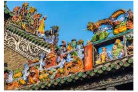
Chen Klanı Atalar Salonu (陈家祠)

Adres: Çin, Guangdong Province, Guangzhou, Liwan District, 沙面 邮政编码: 510130