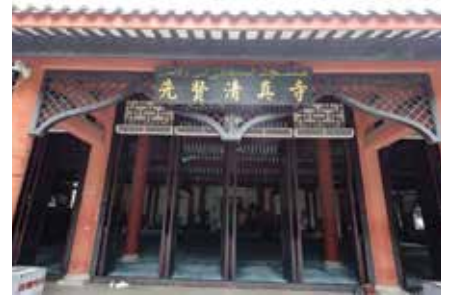
Huaisheng Camii (怀圣寺)

Adres: Çin, Guangdong Province, Guangzhou, Panyu District, 105国道 邮政编码: 511445