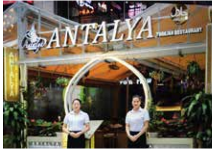
Antalya安塔利亚土耳其餐厅(小北店)

Adres : 环市中路304号首层、二层03铺 (地铁小北站 D出口的另外一边)