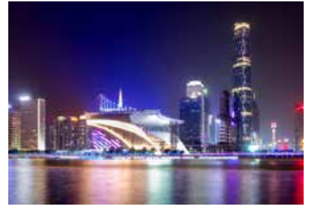
İnci Nehri (Zhujiang Pearl River) (珠江)

Adres: 2 Zhujiang E Rd, Tianhe District, Guangzhou, Guangdong Province, Çin, 510623