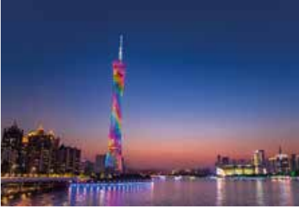
Guangzhou Kanton Kulesi (广州塔)

Adres: Yuejiang W Rd, Haizhu District, Guangzhou, Guangdong Province, Çin, 510308