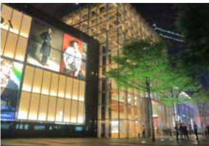
Taikoo Hui (太古汇)

Adres: No.383 Tianhe Road, Tianhe District, Guangzhou 510620 China